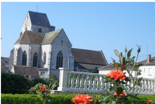
Saint Rémi's Church