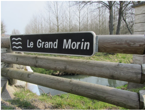
Grand Morin River