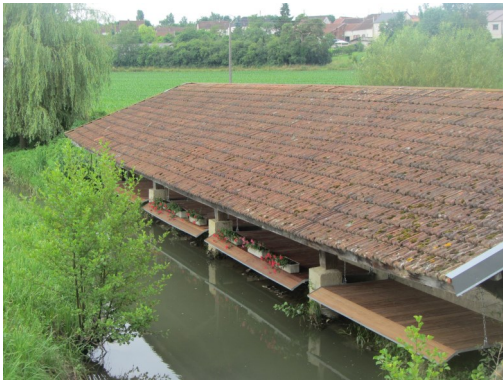
Washing place in Esternay